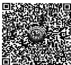
QR Code 1

ตรวจสอบจำนวนผู้ชำระค่าลงทะเบียนแต่ละรุ่น