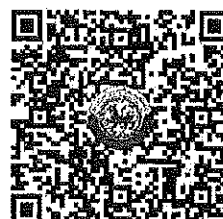
QR Code 2

ตรวจสอบจำนวนผู้ชำระค่าลงทะเบียนแต่ละรุ่น